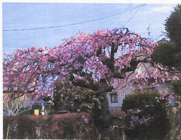
きれいに花をつけたしだれ梅（7丁目）

※令和7年度ごみカレンダーを 3月21日（金）に回覧物と一緒に 配布します。 よろしくお願ひいたします。